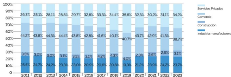
Evolución mensual del indicador de facturación a valores constantes (Base enero 2011 = 100). Últimos cuatro años