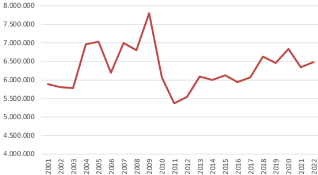
Faena bovina durante el primer semestre de cada año, en base a datos del RUCA.

Envíos a faena: Un mercado bien abastecido donde la diferencia la impone la demanda - 12 de Agosto de 2022