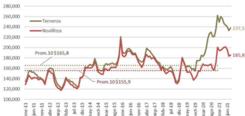
Evolución de los valores corrientes del Novillito y del Ternero liviano, en base a datos del Mercado de Liniers y Entre Surcos y Corrales.

Medido en igual horizonte de tiempo, a valores reales, el precio del novillito ($165,8 promedio agosto) se encontraba un 19% por sobre su valor promedio de 10 años ($155,9) mientras que el precio del ternero ($237,5) resultaba un 43% superior al promedio de los últimos 10 años ($165,8).