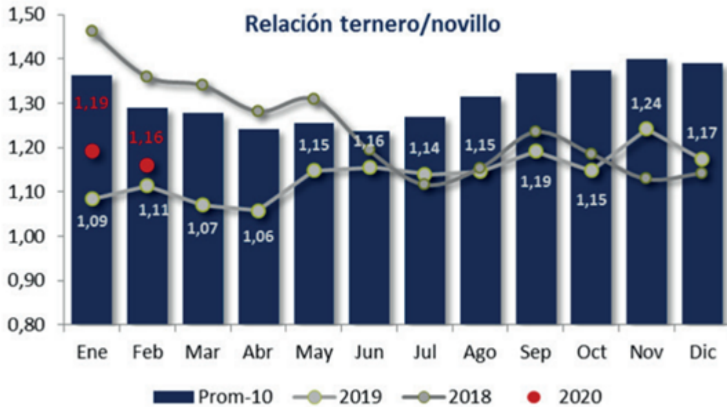
Gráfico 1: Relación de compra ternero/novillo, medido en base a valores promedio mensuales para el ternero de invernada de 160 a 180kg y el promedio de la categoría novillo, comercializado en el Mercado de Liniers.

Mirado desde el lado de la compra, la actual relación ternero/novillo se ubica en torno a 1.16, es decir un 5% superior respecto del año pasado pero un 10% más baja, si se la compara con el promedio para febrero de los últimos 10 años.